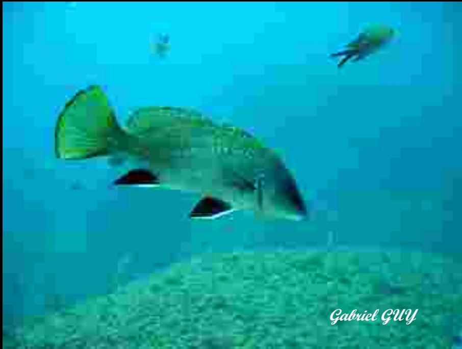
Corb commun (maigre, courbine, corbeau)