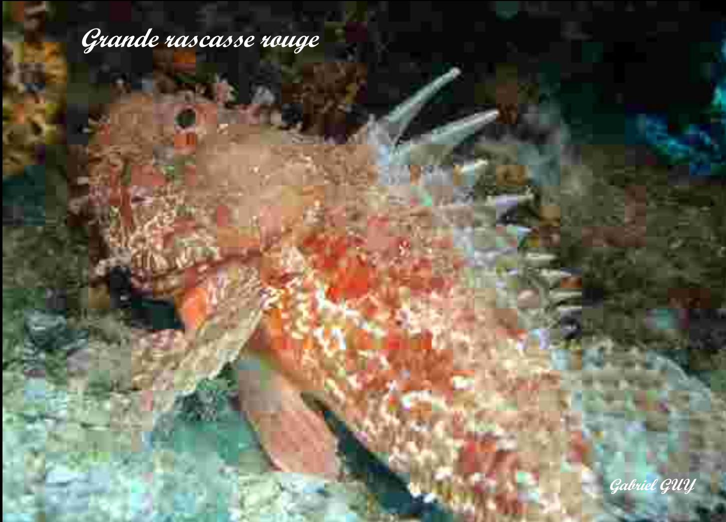
Grande rascasse rouge