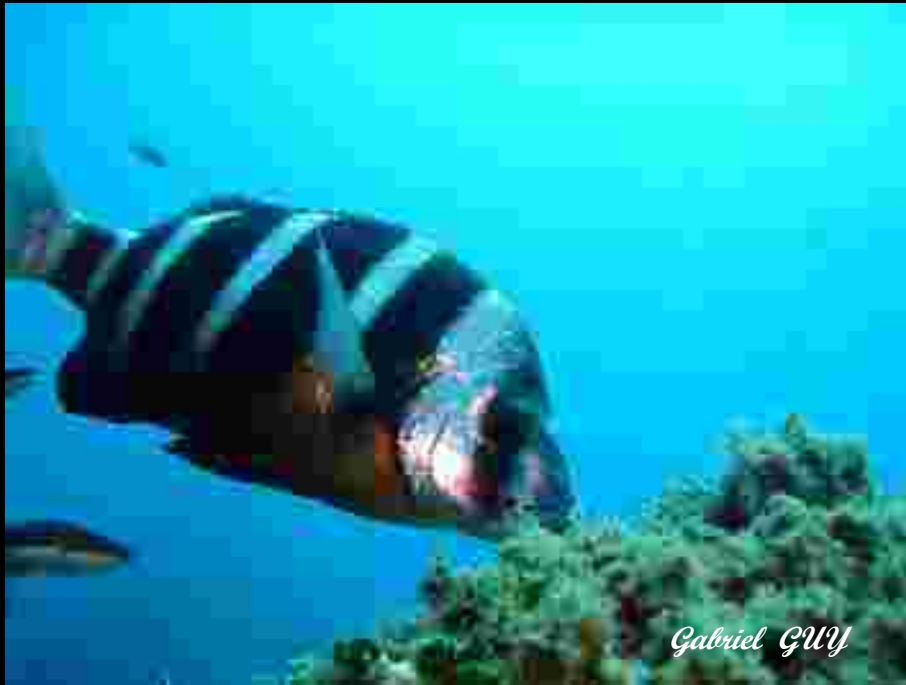
Sax tambour Taille de 10 à 40 cm. (Peut atteindre 55 cm.)

Mulet ou muge Nourriture: débris organiques et petits organismes marins. Supporte des températures élevées et des variations de salinité.